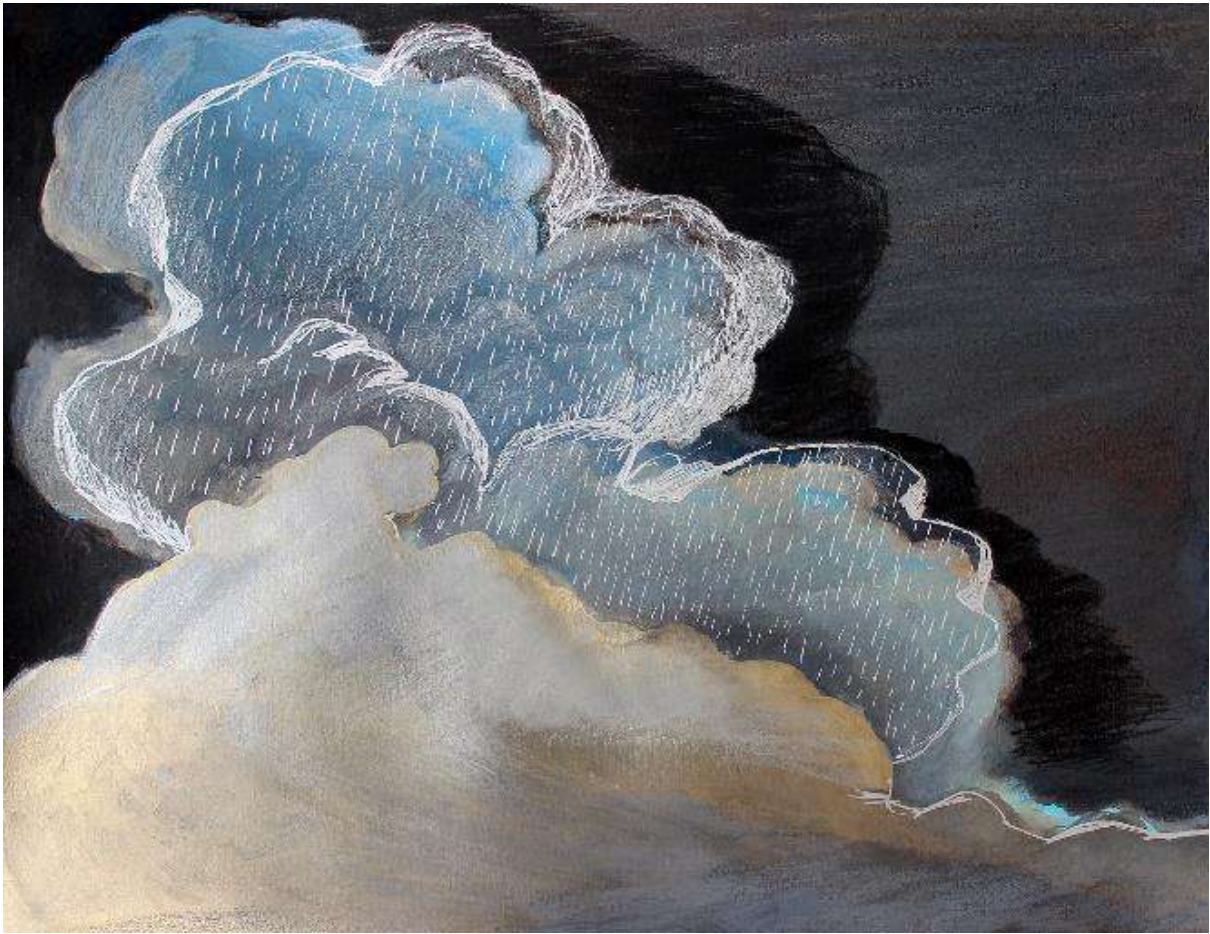
Dilsiz Dünya / Blank Earth Serisi 17, 30 x 40 cm, Kâğıt üzerine Karışık teknik, 2016