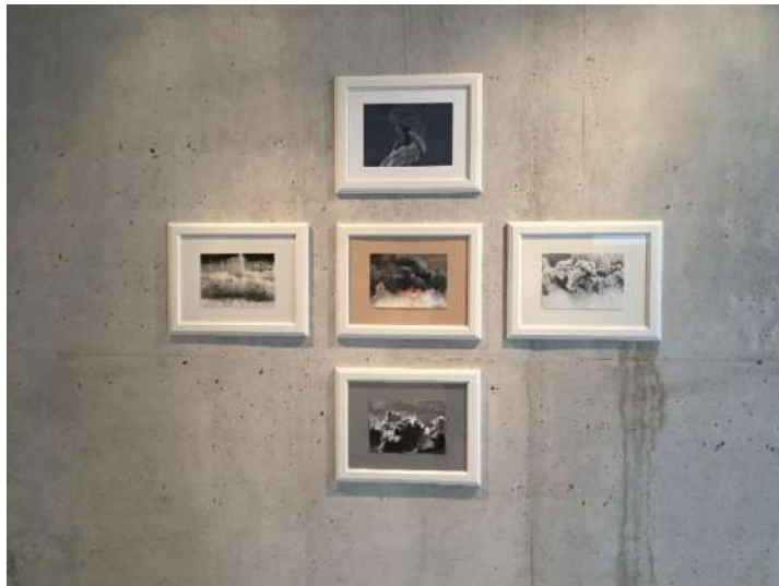
Dilsiz Dünya / Blank Earth Serisi Genel Görünüm, 2016

Kâğıdı, boyası, fonu, çerçevesi ile son derece kaliteli malzemelerle kurulu serginin teknik olarak değerli bir duruşu var. Zemindeki ahşap fonlar resimlerin atmosferini destekliyor. Aquaboard denilen malzeme üzerine yapılan resimler güçlü enerji ve zıtlıkların ortaya konmasına destek veriyor. Dikişlerle yapılan resimler hem çok samimi duruyor hem de farklı bir malzemenin resmin nasıl bir ögesi olabileceğini gösteriyor. Diğer resimlerde görülen ayrışma, dikişlerin kullanıldığı çalışmalarda tam tersi bir durumu, birleştirmeyi vurguluyor. Eserler dünyanın kötücül ve yıkıcı taraflarına vurgu yaparken; dünyanın iyicil ve birleştirici taraflarını, umudu da hissettiriyor.