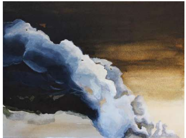
Dilsiz Dünya / Blank Earth Serisi 3, 30 x 40 cm, Aquaboard üzerine Ecolin, 2016 Dilsiz Dünya / Blank Earth Serisi 4, 30 x 35 cm, Kâğıt üzerine mürekkep, 2016 Dilsiz Dünya/ Blank Earth Serisi 32, 25 x 40 cm, Kâğıt üzerine karışık teknik, 2017 Dilsiz Dünya / Blank Earth Serisi 36, 30 x 40 cm, Kâğıt üzerine dikiş, 2016 Dilsiz Dünya / Blank Earth Serisi 16, 30 x 40 cm, Aquaboard üzere Ecolin, 2016