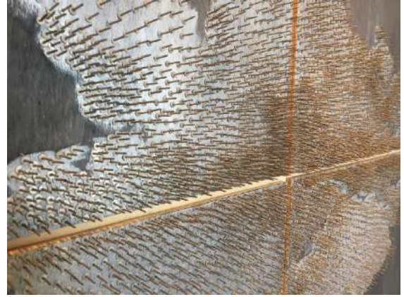
Dilsiz Dünya / Blank Earth Serisi 31, 52 x 70cm x 4 parça, Ahşap üzerine çivi ve Ecolin, 2016, Detay

Dilsiz Dünya sergisinde ortaya çıkan ana formlardan biri de güçlü gerilmeleri ifade eden doğa olayları. 1. Doğa'nın sert ve yıkıcı yapısını ortaya koyan olaylar insanın ürettiklerini yok edebilecek güçte tasvir edilmiş. Tehlikeyi çağrıştıran fırtına, hortum, patlama, püskürme, toz bulutu gibi oluşumlar gücünü hissettiriyor ama izleyende korku yaratmıyor. Resimler karamsar değil, çünkü bu güçlü enerjileri dengeleyen dingin biçimli formlar da var. Resimlerin bir kısmı doğanın ateşli ve dinamik hâllerini yansıtırken; dinginliğini korumaya çalışan, yeniden toparlanmaya çalışan hâlleri de betimliyorlar. Galeriye girdiğinizde karşı duvarın ortasında yer alan fırtına resmi çok güçlü duruyor. Yıkıcı güç ve dinginlik bir arada başarıyla verilmiş. Resmin saf hâlini gördüğümüz eserde çizginin ve boyanın gücünü hissediyoruz. Japon lavilerini de hatırlatan çalışmayı seyrederken içimden keşke biraz daha büyük boyutlu olsa diye geçirdim.