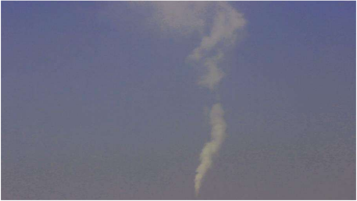
Dilsiz Dünya / Blank Earth Serisi 41, Video imaj, 2016

Videolar ARTE'deki bölünmüş bir alanda sergileniyor. Videonun birinde üç farklı gökyüzü yer alıyor. Biri çıplak gözle görünen; ikincisi su altından; sonuncusu ise giderek karanlığa gömülen, sakin, huzurlu, her şeyin bitmiş olduğu dünyayı vurguluyor. Videoda değişim çok yavaş gerçekleşiyor ve bizi sakinleşmeye, dingin biçimde izlemeye çağırıyor. Genç sanatçının çekim ve kurgusunu kendisinin yaptığı videoların özgün bir atmosferi ve ritmi var. Işıksal, kendi sakin doğasını gayet yumuşak kullandığı kamerasıyla videolarına yansıtıyor. Küçük hareketlerle devam eden görüntüler yavaş ama hep süregiden bir akış sunuyor. Bir aracın içinden gökyüzünü çektiğini diğer video ise ritmik biçimde kayan görüntülerden oluşuyor. Bu video makineleşen çağda hızla geçen ama fark edemediğimiz zamanı ve hayatımızı temsil ederken, bize gökyüzüne sakince bakabilmemizi söylüyor.