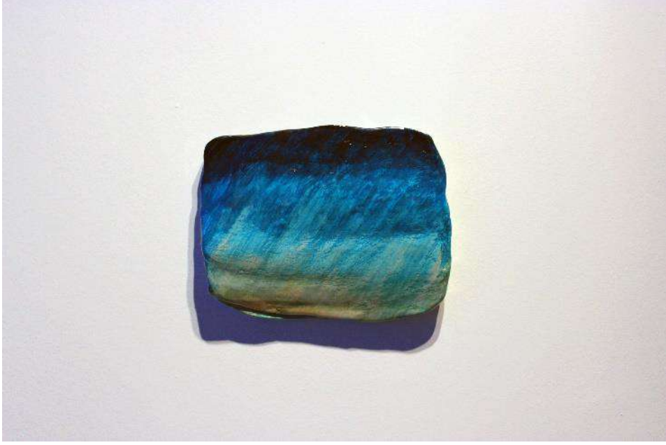
Dilsiz Dünya / Blank Earth Serisi 45, 12 x 16 cm, Karışık teknik, 2016