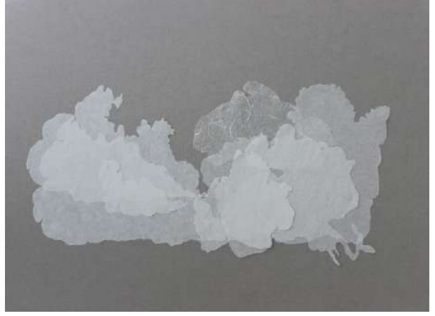
Dilsiz Dünya / Blank Earth Serisi 33, 30 x 35 cm, Işıklı Kutu içi düzenleme, 2016 Dilsiz Dünya / Blank Earth Serisi 12, 30 x 40 cm, Kağıt üzerine transparan kağıt kolaj, 2016

Bulutlar yumuşak ve katmanlı formlar yaratırken hemen yanında yer alan metal çivilerle bezeli dört parçadan oluşan eser zıt bir form olarak karşımıza çıkıyor. Çivilerle oluşturulan yüzeylere sahip bu görkemli eser için toplam 10.000 adet çivi kullanılmış. Sabırla işlenmiş ve zemine tutturulmuş çiviler hem cepheden hem de yan açılardan algılanan güçlü formlarıyla sanatseverleri etkiliyor. Burada hafif, bulutsu form ile metalin sert dünyası zıtlığı doruğa taşırken kirli koyu zemin duyguyu pekiştiriyor.