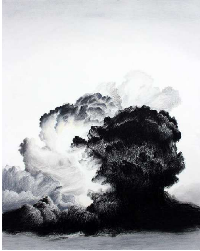
Dilsiz Dünya / Blank Earth Serisi 24, 63 x 83 cm, Kâğıt üzerine füzün, 2016

Kâğıdı, boyası, fonu, çerçevesi ile son derece kaliteli malzemelerle kurulu serginin teknik olarak değerli bir duruşu var. Zemindeki ahşap fonlar resimlerin atmosferini destekliyor. Aquaboard denilen malzeme üzerine yapılan resimler güçlü enerji ve zıtlıkların ortaya konmasına destek veriyor. Dikişlerle yapılan resimler hem çok samimi duruyor hem de farklı bir malzemenin resmin nasıl bir ögesi olabileceğini gösteriyor. Diğer resimlerde görülen ayrışma, dikişlerin kullanıldığı çalışmalarda tam tersi bir durumu, birleştirmeyi vurguluyor. Eserler dünyanın kötücül ve yıkıcı taraflarına vurgu yaparken; dünyanın iyicil ve birleştirici taraflarını, umudu da hissettiriyor.