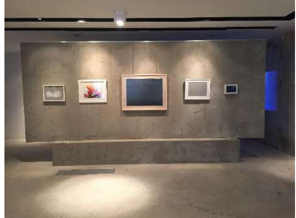
Aslı Işıksal "Dilsiz Dünya / Blank Earth" Sergisinden Genel Görünüm

"Gökyüzü teması anonim ve riskli, bu yüzden yağlı boya gibi geleneksel malzemeden kaçarak daha deneysel malzemelere ağırlık verdim" diyor genç sanatçı. Dilsiz Dünya'da mürekkep, füzen, özel yapım kâğıtlar, dikiş, küçük boyutlu metal çivi, plastik yüzey, LED ışıklı panel, seramik, fotoğraf, video gibi farklı malzeme, medya ve teknikler ustalıkla bir arada kullanılmış. Bu kadar fazla malzemenin bir arada yer aldığı çalışmada sanatçının kendi deyimiyle "Sanatın temel meselesi olan arayış ve keşif ön planda tutulmuş." Bir başkasının elinde karmaşa yaratacak kadar fazla olan malzeme, Aslı Işıksal'ın sakin ve aritmetiği sağlam dünyasında doğru yerlerini bulmuşlar. Işıksal'ın işlerinde sanatta artık özlemini çokça duyduğumuz bir samimiyet var. İşler, içerik itibarıyla hayli iddialı ama ortaya konulma biçimleri son derece yalın ve içten. Ama bu yalınlık eserlerin kolayca yapıldığını göstermiyor. Sanatçı her bir resim için ayrı emek vermiş. Her birinde ayrı bir resimsel dert edinip, her birinde farklı bir teknik uygulamış. Sanatının emek gerektiren, yerin geldiğinde ince işçilik hatta zanaat gerektiren zorunluluğu bildiği için hiç bir işte kolaya kaçmamış. Eserlerinde etkileyici yüzeyler ve dikkat çekici dokular oluşturan Işıksal, orta ve küçük boyutlu işlerle de çarpıcı bir sergi çıkarılabileceğini göstermiş.